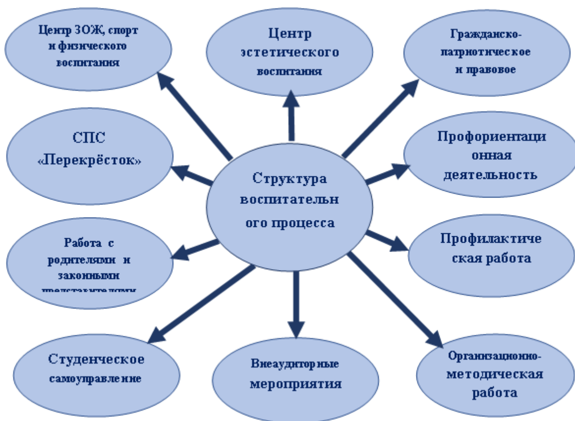
Рисунок 1 Организационная структура воспитательной работы

Организационная структура воспитательной работы представлена на рисунке 1